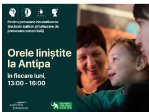
Vizual pentru părinți

Pregătiți materiale de comunicare vizuale atât pentru părinți, cât și pentru copii, pe înțelesul lor. Distribuți-le în social media, dar și prin email, alături de alte materiale care le vor explica copiilor ce se va întâmpla la eveniment - reduceți astfel anxietatea pe care copiii o pot simți atunci când ies din rutina lor.