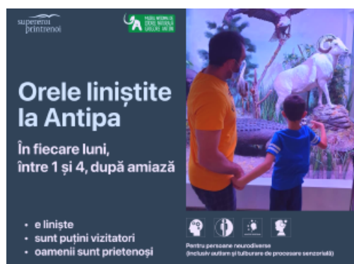
Vizual pentru copii